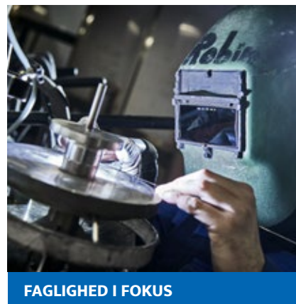
FAGLIGHED I FOKUS

På alle niveauer arbejder vi med sans for de detaljer, der er afgørende for et slutprodukt af højeste kvalitet.